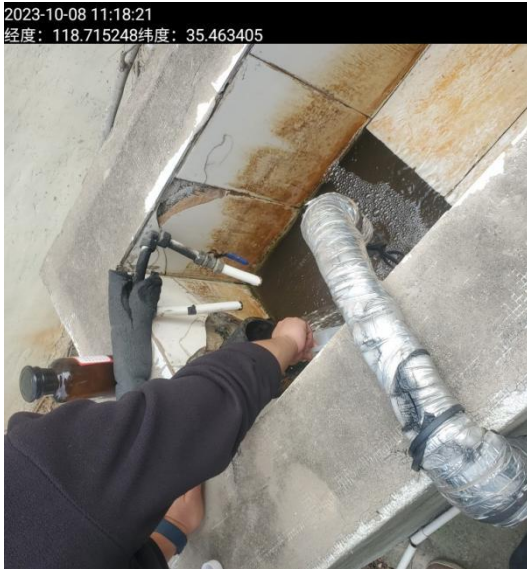
图 1: 污水现场照片