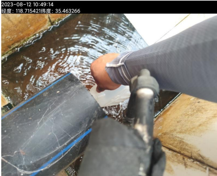
图 1: 污水现场照片